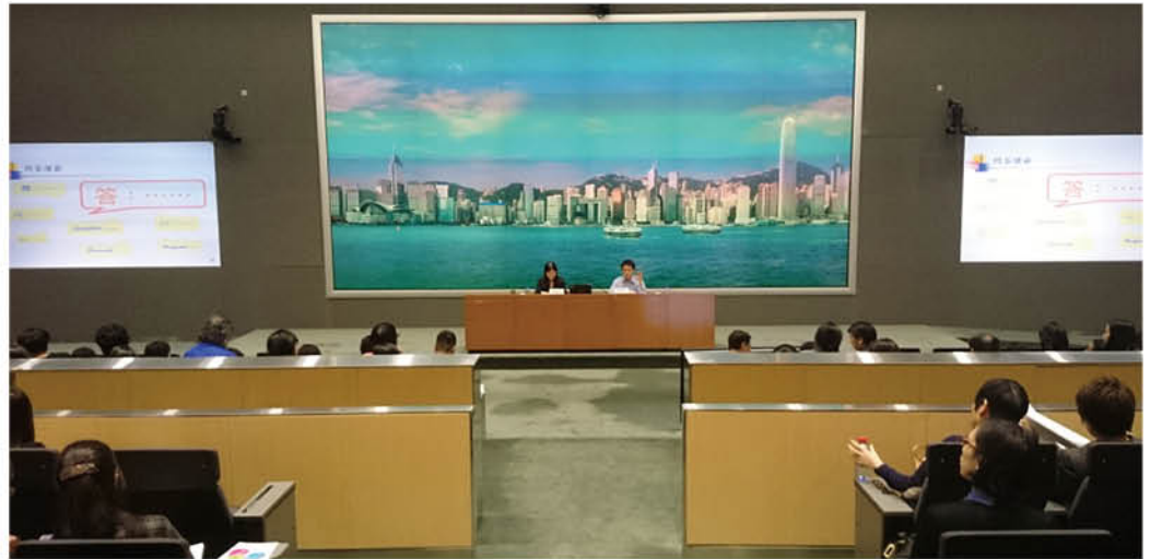
■ 政制及內地事務局會透過舉辦研討會及簡介會，向公私營機構推廣及介紹《守則》。

《守則》除了為「性傾向」、「歧視」、「騷擾」等提供釋義之外，亦就僱傭範疇中的不同環節，例如招聘、晉升、調職、培訓、解僱及僱傭條款與條件等，提出建議的良好常規。政府不但承諾致力遵從《守則》所載的各項常規，也同時積極鼓勵公私營機構採納《守則》，例如去信本地主要公私營機構的最高管理層，向他們推廣《守則》，呼籲採納當中所載的措施。根據政制及內地事務局最近的公布，約有90間公私營機構已承諾採納《守則》，自願地遵從當中的良好常規，消息令人鼓舞。