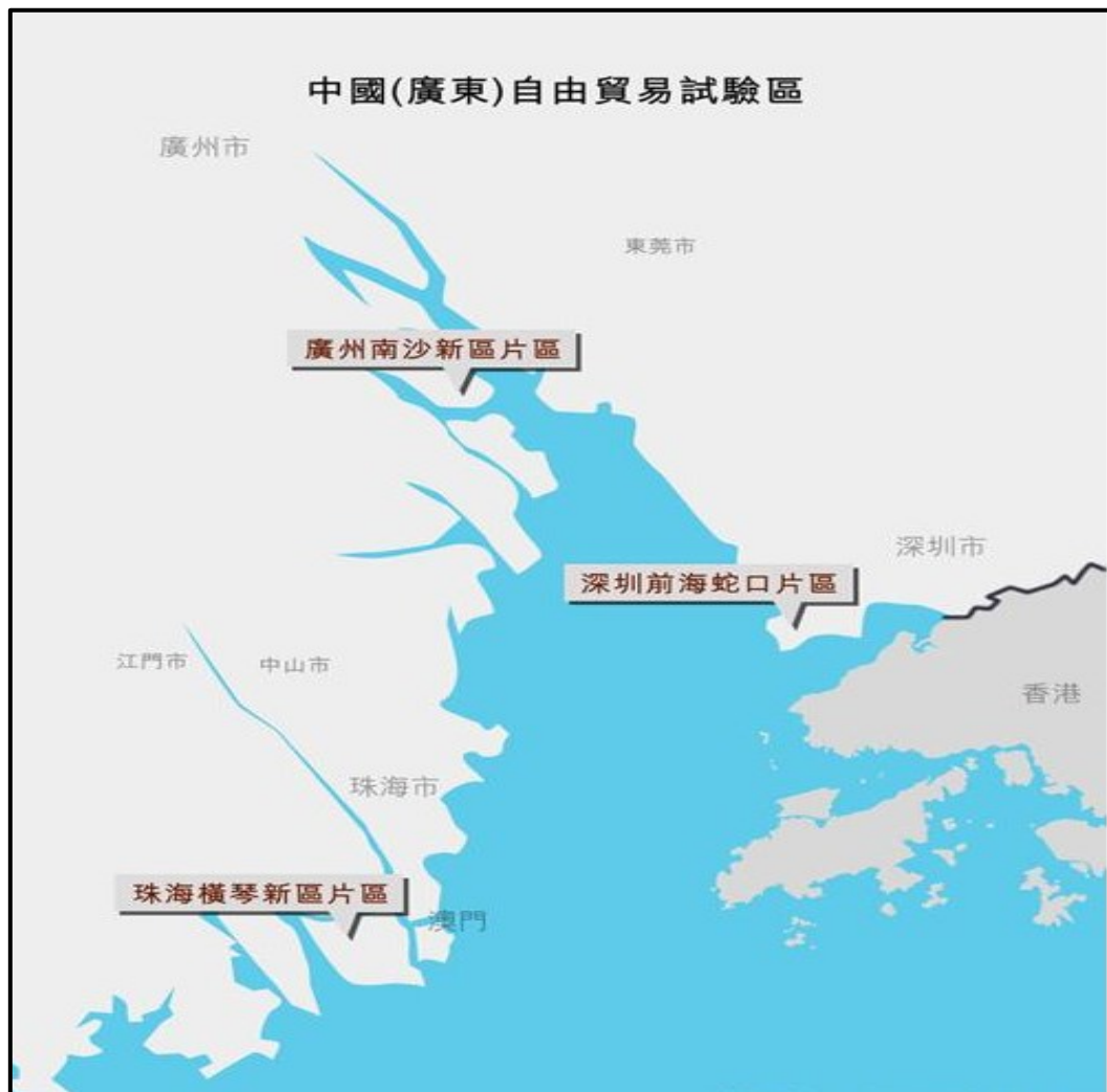
圖一、中國（廣東）自由貿易試驗區

11. 南沙的地理位置優越，處於珠三角的幾何中心地帶，水陸交通便利，往來廣州、香港和澳門只需約一小時。2012 年 10 月發表的《廣州南沙新區發展規