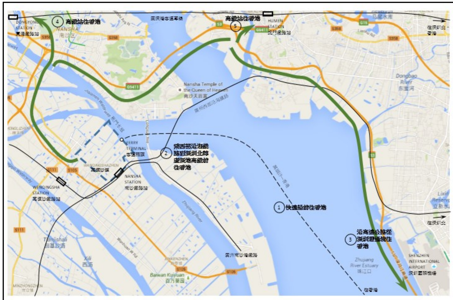
圖二、「合作啟動區」與香港的交通連接